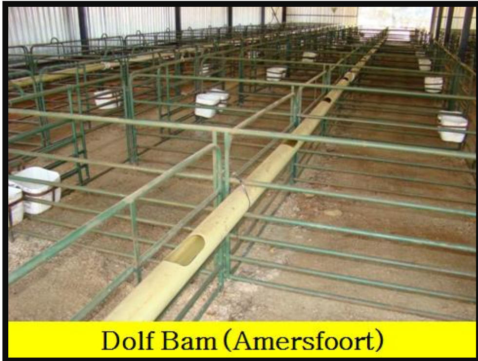
Dolf Bam (Amersfoort)