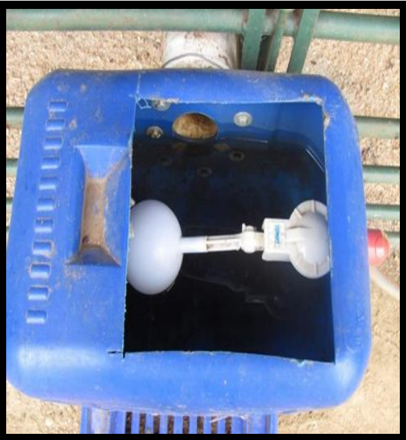
Watervlakbeheer deur “ball valve” op regte hoogte in waterlyn te plaas