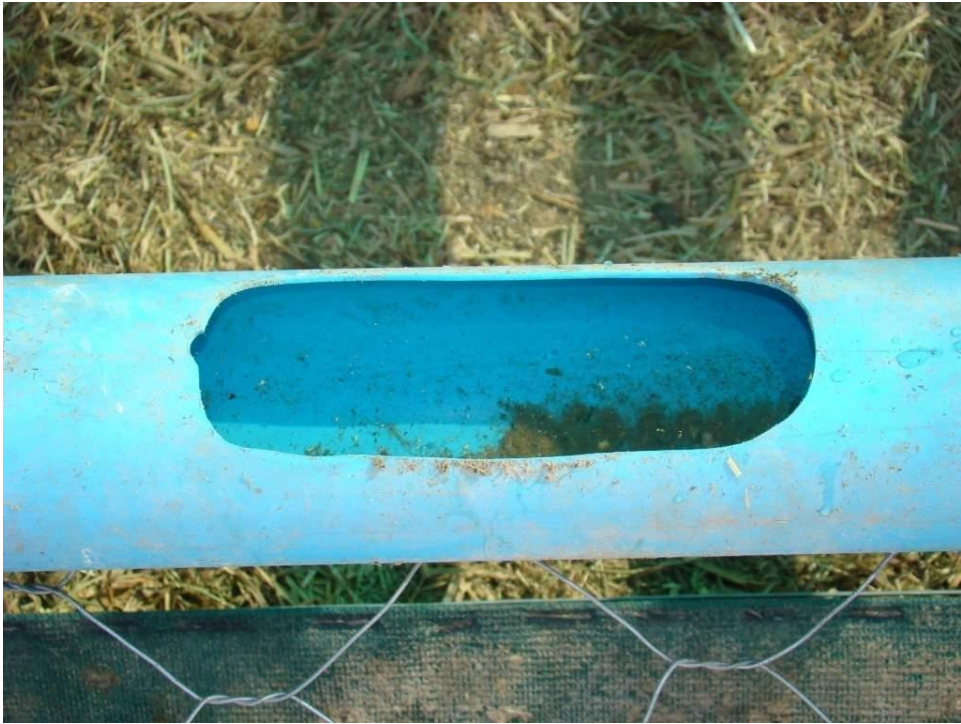
Opening in plastiese pyp waaruit skape water drink