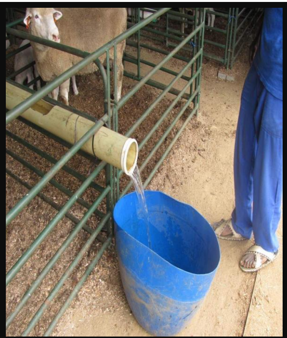
Skoonmaak van waterlyn