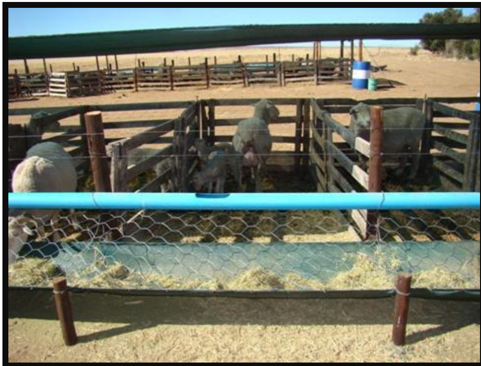
Riool plastiese pyp met opening in waaruit skape water drink