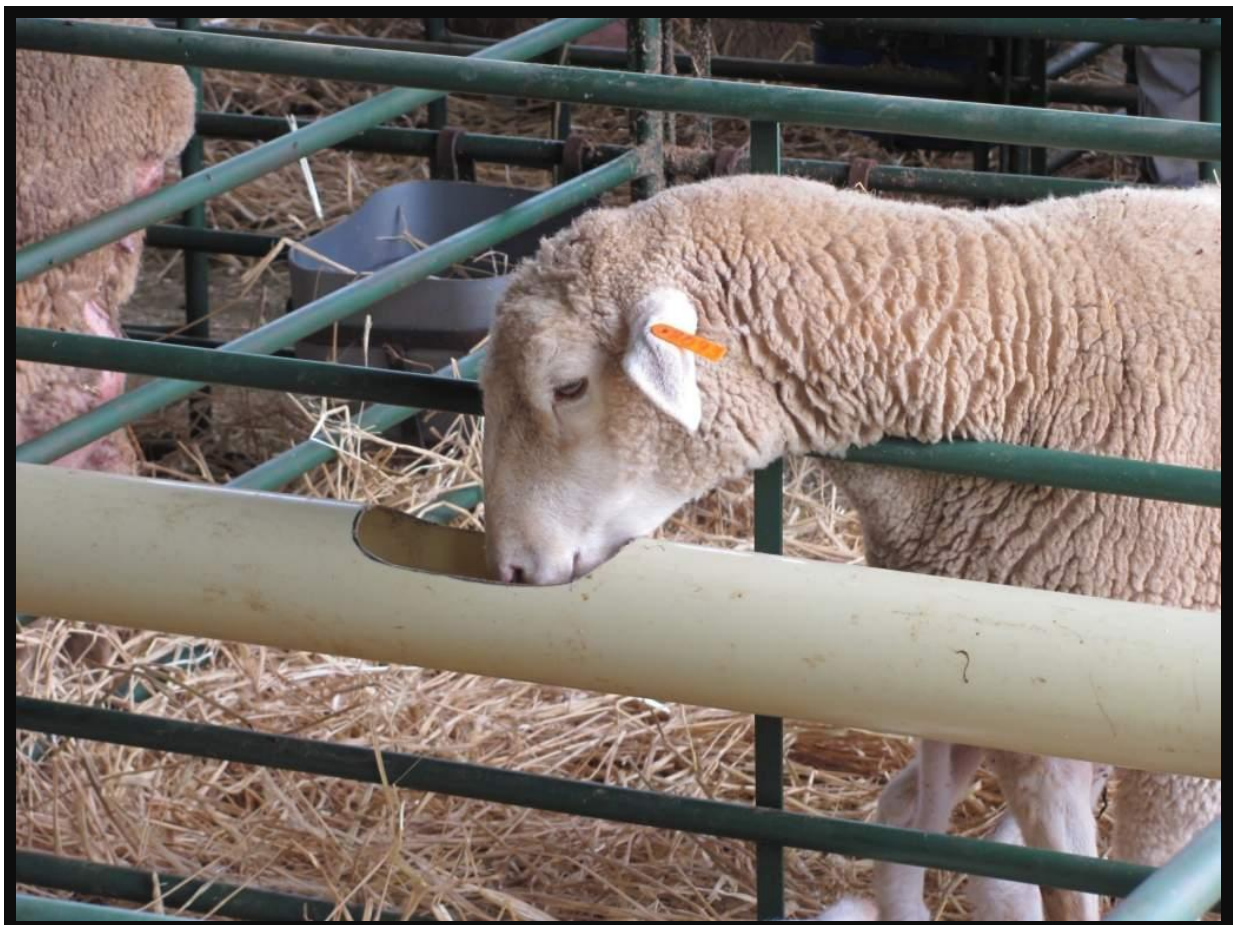
Lamhokke met watervoorsieningslyn