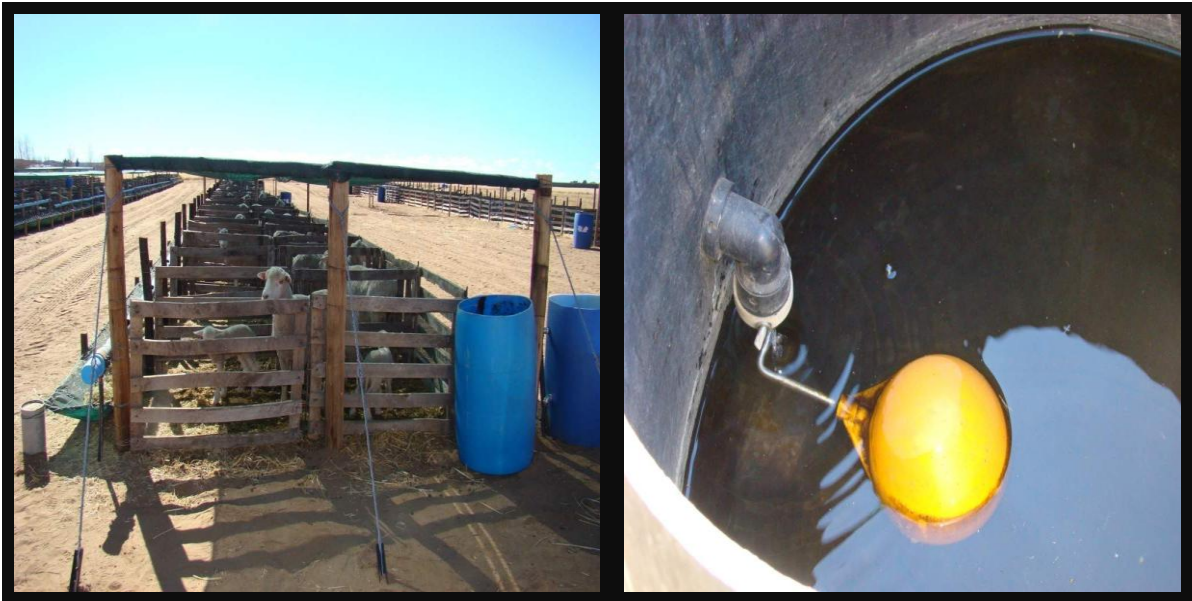
Plasiese drom met "ball valve" in om watervloei te reguleer